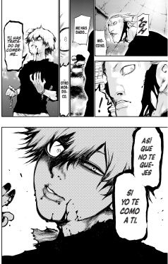
(Capítulo #064: Molestia de Tokyo Ghoul)

La violenta organización ghoul Aibol Aogiri secuestra a Kaneki, quien renace tras ser sometido a una tortura indescribible, mientras la CCG y el Aogiri se enfrentan fuertemente.