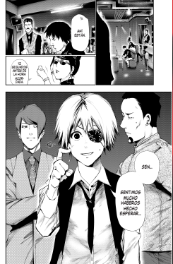
(Capítulo #084: Emisión de Tokyo Ghoul)