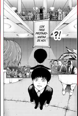
(Capítulo #037: Cena de Tokyo Ghoul)